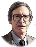
○ 롤스(Rawls, J.)

천부적 재능과 최초의 사회적 지위는 단지 자연적 사실일 뿐, 정의롭지도 부정의하지도 않다. 한 사회가 정의로운지 부정의한지는 그 사회가 천부적·사회적 우연성을 어떻게 처리하느냐에 달려 있다. 계급 사회가 부정의한 이유는 특권을 가진 계층에 대해 우연성을 근거로 결정하기 때문이다. 하지만 공정으로서의 정의는 공동의 이익을 가져오는 경우에만 천부적·사회적 여건의 우연성을 이용하기로 약속한다.