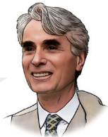
○ 노직(Nozick, R.)

역사적 소유 권리론은 정형적이지 않으므로 도덕적 응분에 따른 분배를 받아들이지 않는다. 자신이 소유 권리를 갖는 소유물이라면 누구에게나 줄 수 있으며, 이는 그 수취자가 받을 만한 응분의 자격이 있는가의 문제와는 별개이다. 개인은 자신의 자연적 자산이 도덕적 관점에서 볼 때 임의적이든 그렇지 않은 간에 그것에 대한 소유 권리를 지니며, 이로부터 유출되는 것에 대해서도 그러하다.